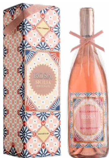
Донафугата и Dolce & Gabbana Розе 2023