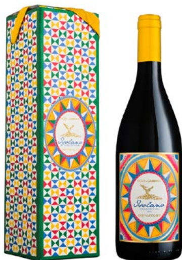
Донафугата Изолано Етна Бианко DOC Dolce & Gabbana 2021